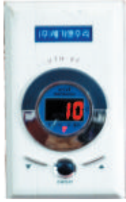
Digital Termostat 4 kW( max)

EN EKONOMİK... Tam gün çalışmaz. Namaza 5 dakika kala açılması halıların ısınması için yeterlidir. Günde en çok 1 saat devrede kalır.